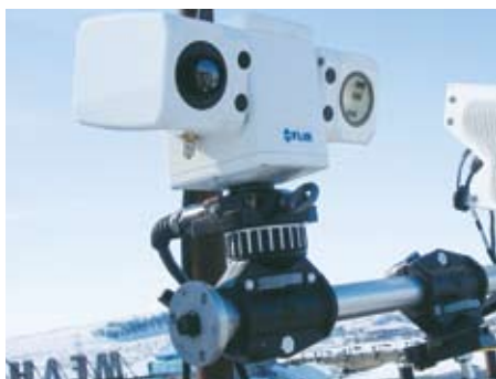
Les caméras thermique PTZ-35 MS et PTZ-50 MS peuvent s'intégrer dans les réseaux CCTV existants.